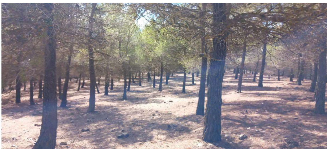
imagen bosque blanco (símbolo 405)

Los orientadores entregarán su mapa a la llegada hasta que se produzcan todas las salidas.