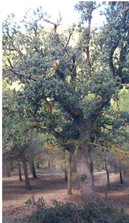
Encinas salteadas dentro del pinar, representadas con el símbolo 418