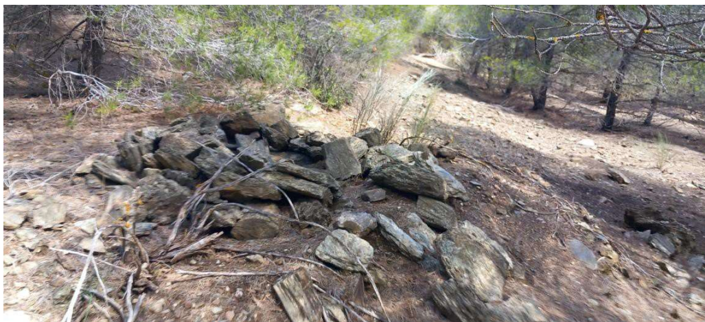
Puesto de cazador, representado con el símbolo 530