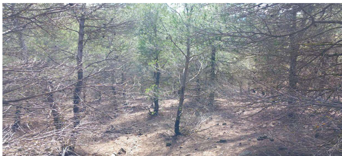
imagen bosque verde 1 (símbolo 406)